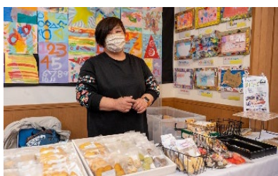
ラポールファームさん