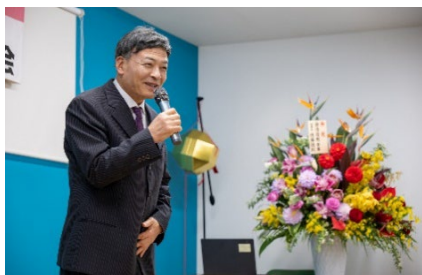
難波市長ありがとうございます！