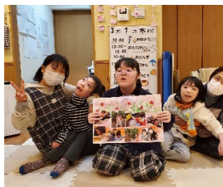
るんるんの卒業生