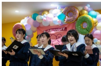
英和女学院音楽部さん