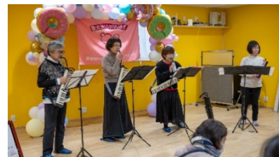
ケンハモCLUB静岡さん