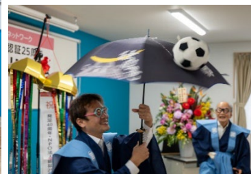
余興盛り上がりました♪