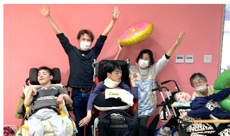
にこにこの卒業生

にこにこの3人は生活介護へと移行し、るんるんの2人は新しい事業所で新生活を スタートされます。どのような道に行っても、また会える日を楽しみにしています。